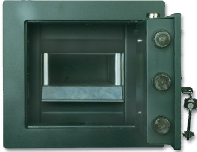
TOLVA EN POSICIÓN DE INTRODUCCIÓN DE LA BOLSA